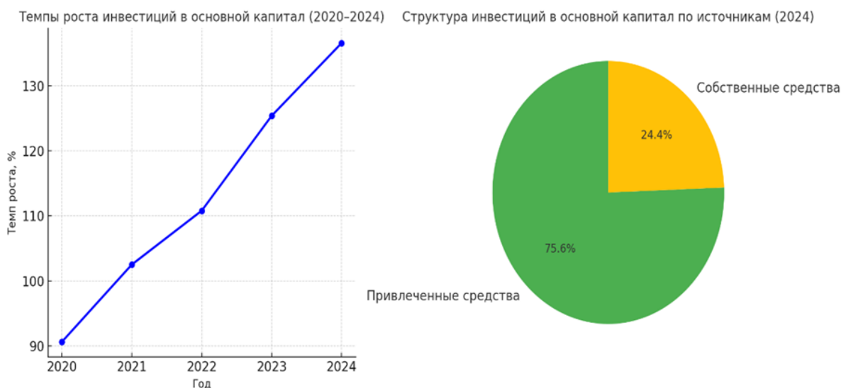
Рис. 2. Темпы роста инвестиции в основной капитал Республики Таджикистана в 2020-2024 гг. и структура инвестиции в основной капитал по источникам в 2024 г.

Таджикистане наблюдается значительная волатильность темпов роста данного показателя, что отражает как внутренние структурные особенности экономики, так и внешние вызовы.